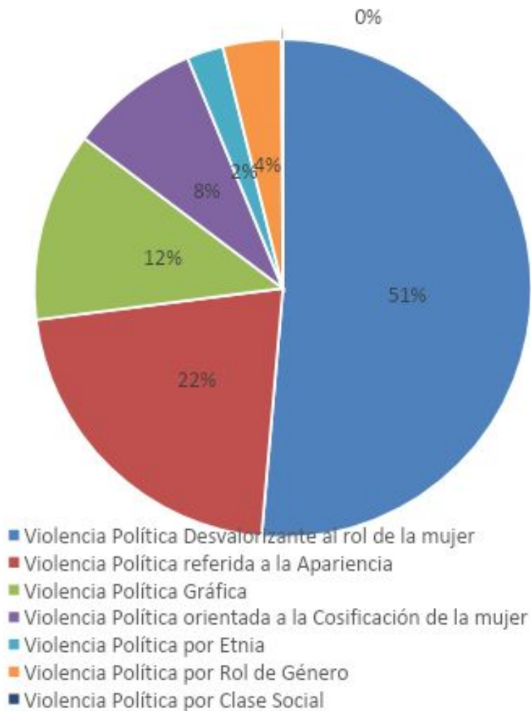
ASPECTOS VIOLENCIA POLÍTICA