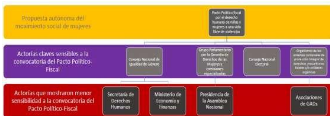
Ilustración 8. Valoración de actorías políticas institucionales sensibles al género en el proceso del Pacto Político Fiscal por el Derecho Humano a una Vida Libre de Violencias.

A continuación, se ejemplifica esta valoración a partir de la experiencia generada en el proceso del Pacto Político Fiscal por el Derecho Humano de Mujeres y Niñas a una Vida Libre de Violencias: