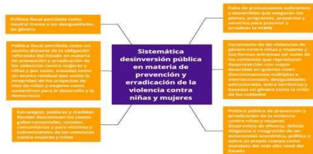
Ilustración 11. El problema, sus causas y consecuencias. Consenso de las organizaciones promotoras y adherentes al Pacto Político Fiscal por el Derecho Humano de Niñas y Mujeres a una Vida Libre de Violencias.