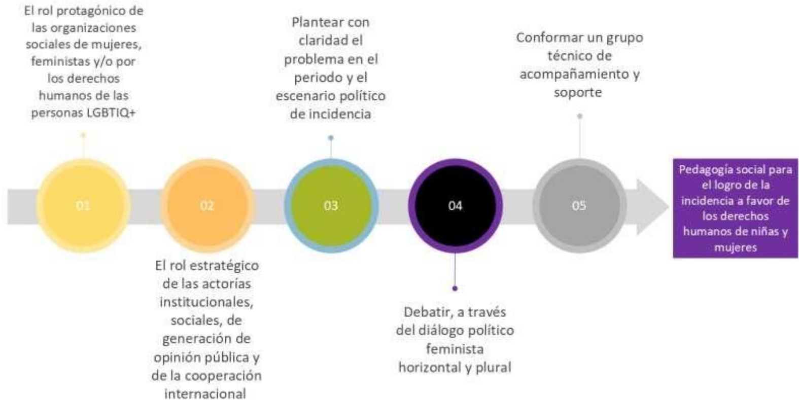
Ilustración 1. Elementos de la estrategia metodológica para el fortalecimiento de capacidades sociales e institucionales para la incidencia Pacto Político Fiscal por el Derecho Humano de Niñas y Mujeres a una Vida Libre de Violencias.