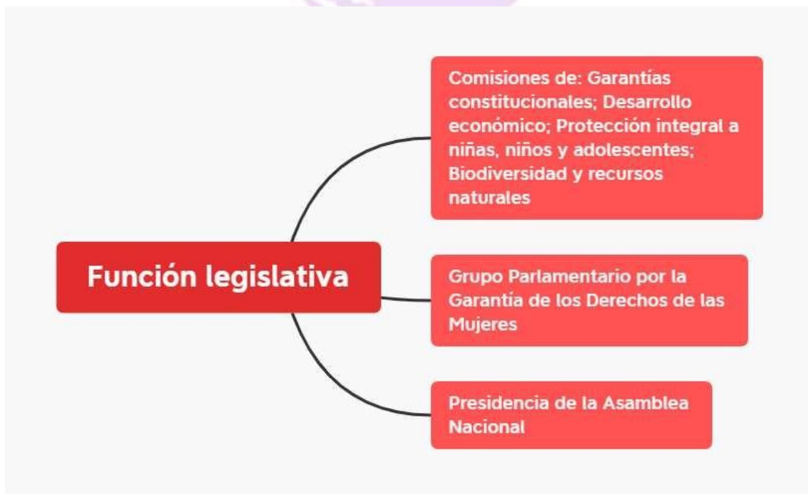
Ilustración 5. Entidades de la función legislativa convocadas al Pacto Político Fiscal por el Derecho Humano de Niñas y Mujeres a una Vida libre de violencias.