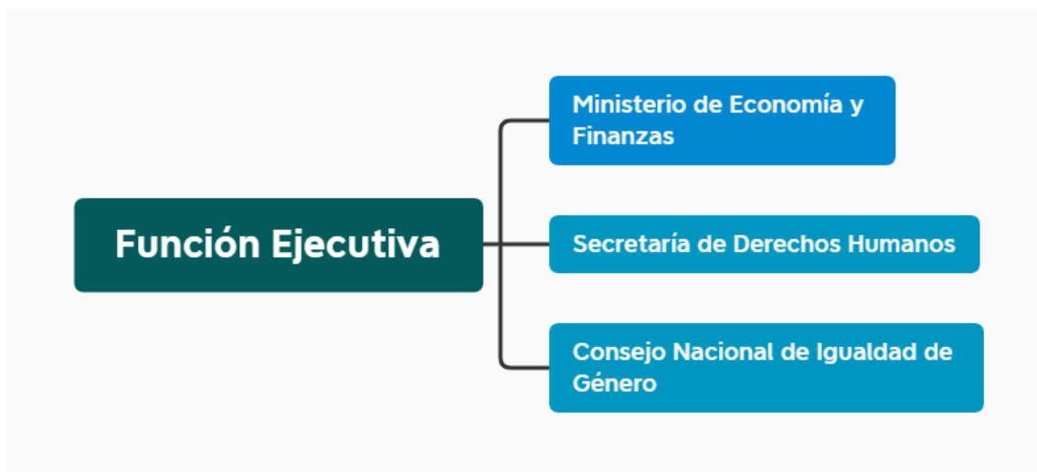
Ilustración 4. Entidades de la función ejecutivas convocadas al Pacto Político Fiscal por el Derecho Humano de Niñas y Mujeres a una vida libre de violencias.