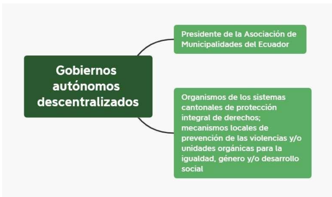
Ilustración 7. Entidades de los gobiernos autónomos descentralizados convocadas al Pacto Político Fiscal por el derecho humano de niñas y mujeres a una vida libre de violencias.