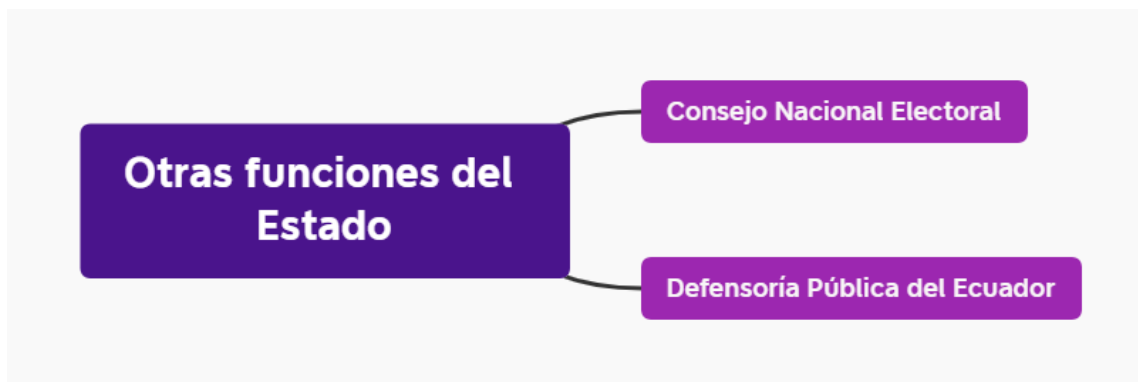
Ilustración 6. Otras funciones del Estado convocadas al Pacto Político Fiscal por el Derecho Humano de Niñas y Mujeres a una vida libre de violencias.