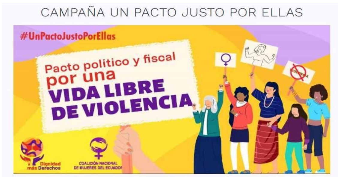
Ilustración 9. Imagen de la campaña #UnPactoJustoPorEllas