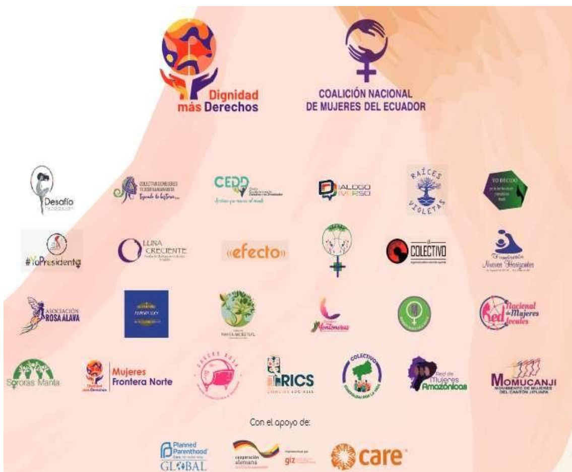
Ilustración 3. Organizaciones sociales adherentes al Pacto Político Fiscal por el Derecho Humano de Niñas y Mujeres a una Vida Libre de Violencias