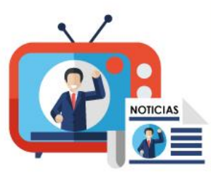
Gráfico N° 3