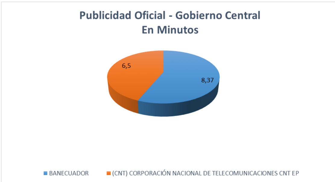
Gráfico N° 1

Para elaborar el presente informe se registran los spots , tomando en cuenta el tiempo de difusión, el número de spots y el o los logotipos institucionales de las entidades del Estado que aparecen en cada producto transmitido, en los 11 medios monitoreados.