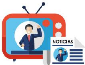
Gráfico N° 2