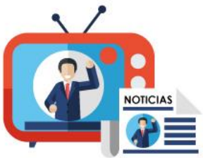
Gráfico N° 4